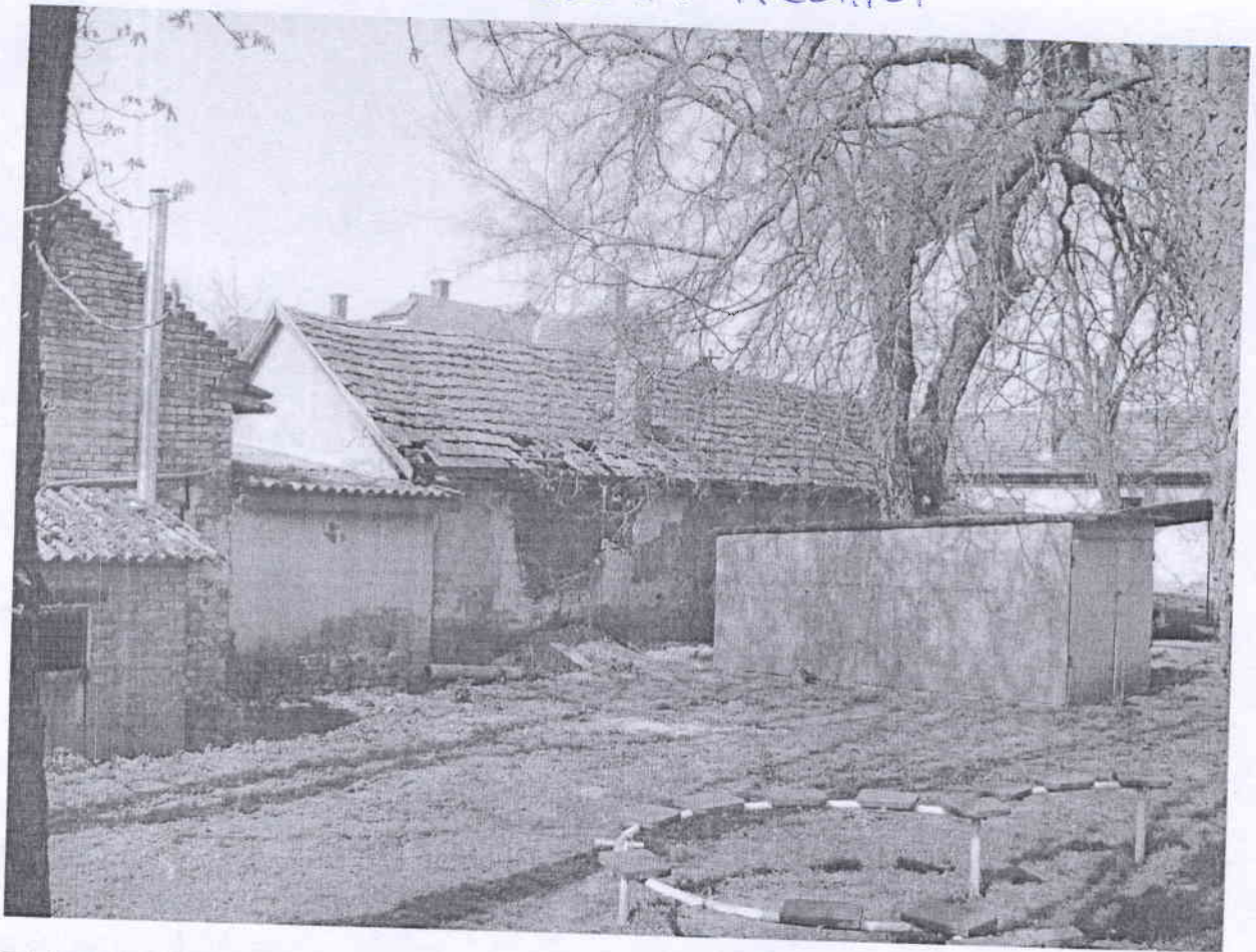
NAGYKÖRÖSI ÚT S. BONTÁS ELŐTTI ÁLLAPOT