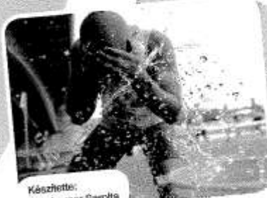
Készítette: Hamburger Sarolta