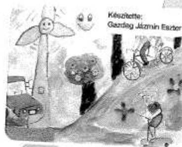
Készítette: Gazdag Jázmin Eszter

A facebookon is fent vagyunk! www.facebook.com/EMH.AMN