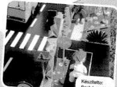
Készítette: Szabó család