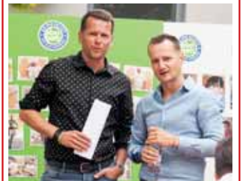
A Szebeni testvérek

Nagy megtiszteltetés, hogy jelen lehettem az Abonett 35. születésnapján és közelről láthattam, hogy kik azok, akik nap, mint nap kemény munkával írják legfőképp a cég, de egyben egy kicsit városunk, Abony sikertörténetét is! Szívvel gratulálok a Szebeni családnak a hosszú, kitaró munkához és az összetartó, sikeres csapathoz! Boldog Születésnapot!” – Pető Zsolt polgármester