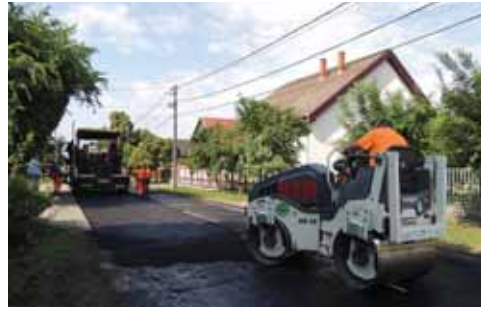
Erzsébet királyné utca felújítása

Elkészült az útépitési terve és hamarosan befejeződik az engedélyezési eljárása az alábbi utcáknak: Mária Terézia,