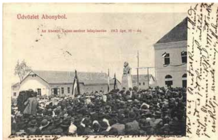
Abonyi Lajos szobrának avatása