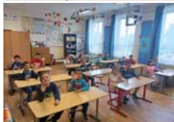
Berendeztek egy tantermet az adomány iskolabútorokkal

Szeptember 3-án Abony Város általános iskoláiban tettek látogatást annak a német segítő szervezetnek a tagjai, akiktől tavaly év végén az oktatási intézmények jól felszerelt iskolatáskákat kaptak ajándékba. A Kelet-Európa Misszió (KEMA) magyar szervezet vezetőivel és tagjaival közösen adták át a né-