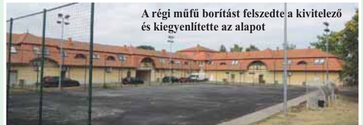
A régi műfű borítást felszedte a kivitelező és kiegyenlítette az alapot

Új borítást kap a Mucsányi Tamás műfüves pálya egy nyertes pályázatnak köszönhetően. Lapzártánk után már a pálya is használható lesz a tervek szerint. A projektet az EMMI támogatja, a beruházás összértéke 16.412.267 Ft