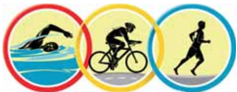
XXI. Fergeteg Triatlon verseny