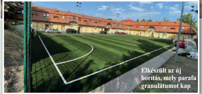
Elkészült az új borítás, mely parafa granulátumot kap