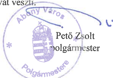
Pető Zsolt polgármester

Ez a rendelet a kihirdetését követő napon lép hatályba, és a kihirdetését követő második napon hatályát veszti.