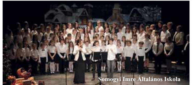
Somogyi Imre Általános Iskola