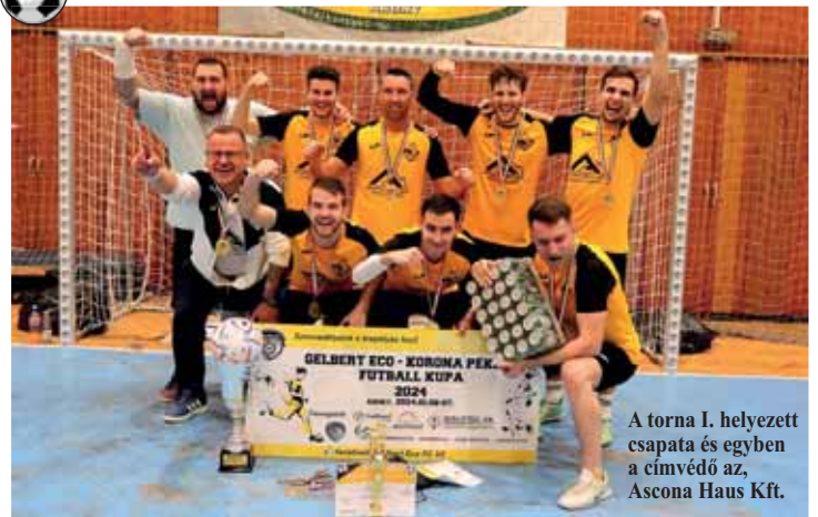
A torna I. helyezett csapata és egyben a címvédő az, Ascona Haus Kft.

Rendkívül színvonalas 24 csapatos országos teremlabdás tornát szervezett a Gelbert ECO FC, január 7-én és 8-án a Varga István Városi Sportcsarnokban. Ezúton is szeretettel gratulálunk a szervezőknek!