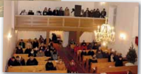
Török János Református Oktatási Központ Kinizsi Pál Gimnáziuma

Oktatási intézményeink az adventi időszakban csodálatos hangversenyeket szerveztek, melyek hozzájárultak az ünnepvárás felemelő érzéséhez.