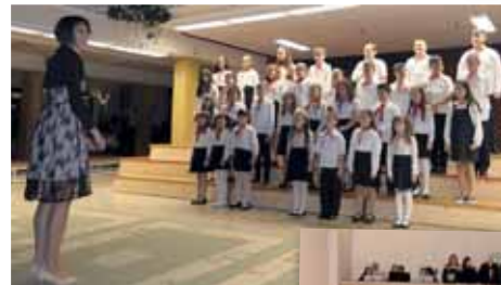
Gyulai Gaál Miklós Általános Iskola AMI