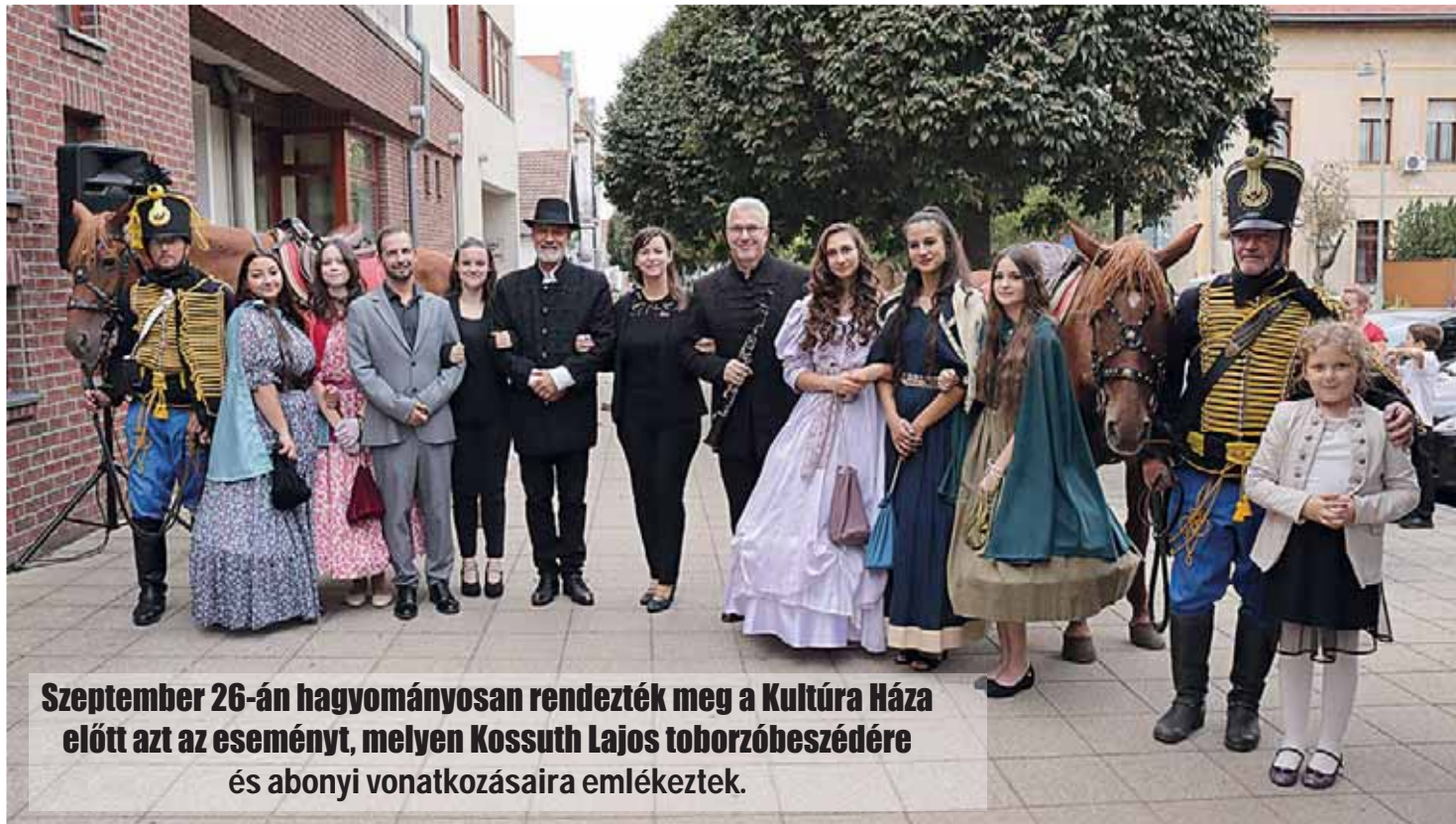
Szeptember 26-án hagyományosan rendezték meg a Kultúra Háza előtt azt az eseményt, melyen Kossuth Lajos toborzóbeszédére és abonyi vonatkozásaira emlékeztek.